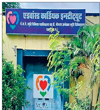
आठ महीने के ब्रेक के बाद एसीआई के मरीजों को मिलेगी राहत