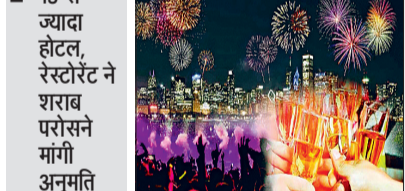
इस तरह सख्ती बरती जाएगी